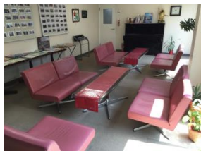
談話コーナー (PCとプリンタ有)