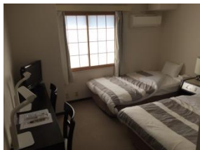
洋室(和室も有、バス・トイレ付) (各部屋、共用部でWi-Fi利用可)