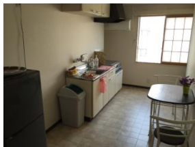
共用キッチン (持ち込み可、鍋や皿完備、近隣にコンビニ有)